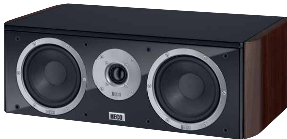
Music Style Center 2