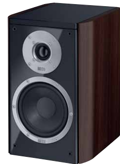
Music Style 200