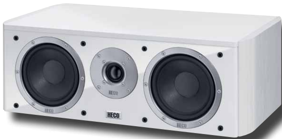
Music Style Center 2