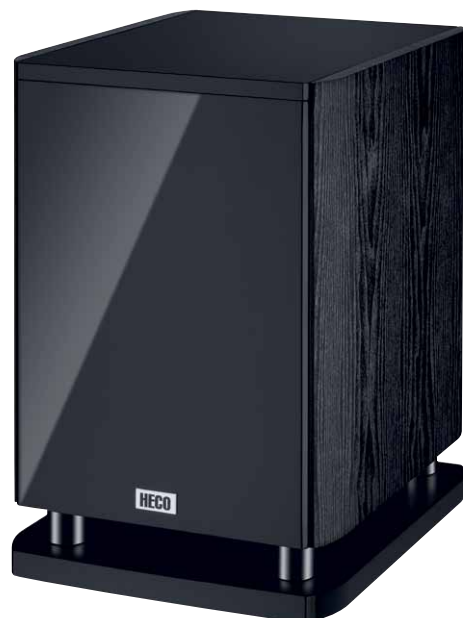
Music Style Sub 25 A