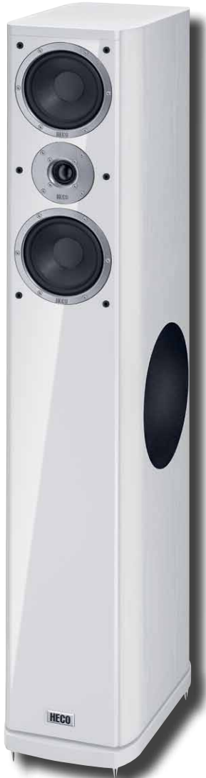
Music Style 800