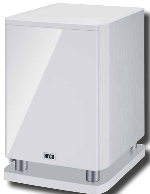
Music Style Sub 25 A