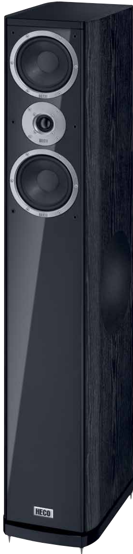
Music Style 800