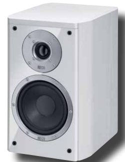
Music Style 200