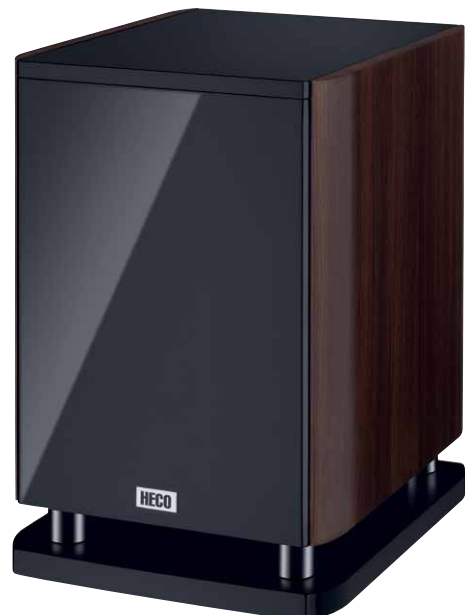
Music Style Sub 25 A