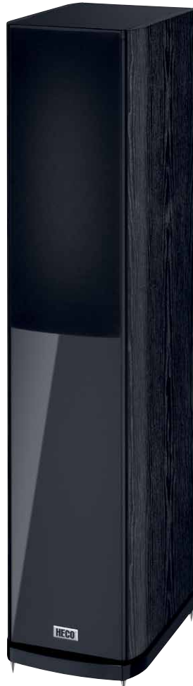
Music Style 500