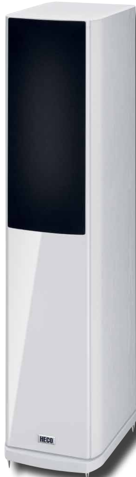
Music Style 500