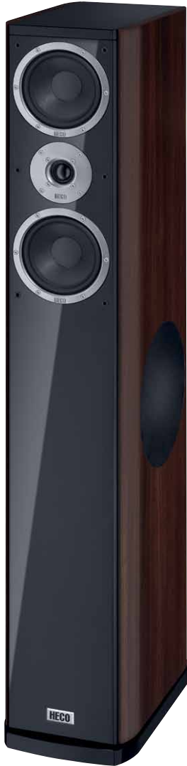
Music Style 800