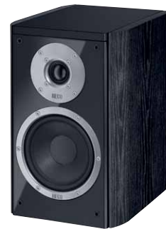
Music Style 200