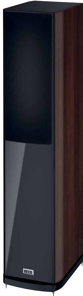
Music Style 500